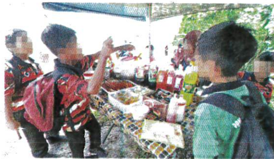
SALAH sebuah gerai menjual makanan ringan yang menjadi tumpuan murid-murid dan pelajar sekolah.

"Saya sangat pentingkan pemakanan anak, tiada makanan segera atau makanan ringan di