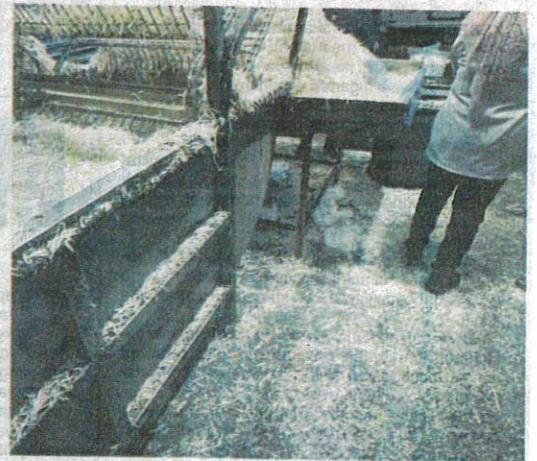
Premis memproses tauge beroperasi dalam keadaan kotor.

DBKL mengingatkan semua pemilik premis sentiasa menjaga kebersihan dan mematuhi undang-undang ditetapkan dalam syarat lesen perniagaan.