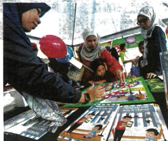
Kakitangan Kementerian Komunikasi melayan pengunjung yang singgah di ruwai Kementerian itu pada Karnival Kita MADANI Peringkat Negeri Selangor yang berlangsung di Dewan Datuk Penggawa Permatang Kuala Selangor, semalam.

STSS yang juga dikenali sebagai jangkitan streptokokus inva-