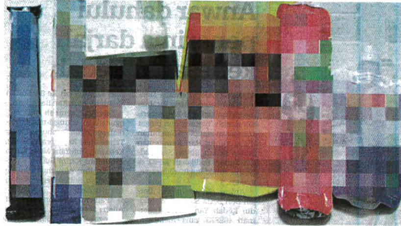
ANTARA jajan import dari China yang kerap dijual di hadapan sekolah dan dibeli oleh murid-murid serta pelajar.

AKHBAR : KOSMO MUKA SURAT : 3 RUANGAN : NEGARA